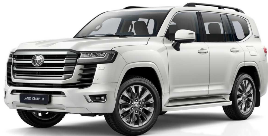
Toyota Land Cruiser 300 (2022)