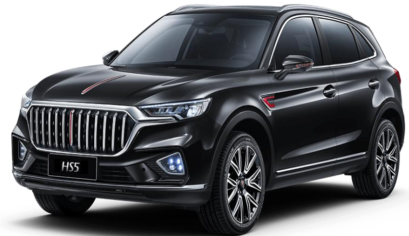
Hangqi HS5 (2022)