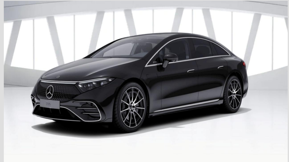
(Mercedes-Benz EQS 2022)