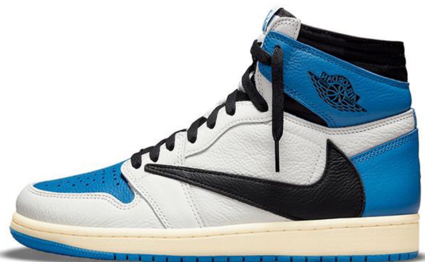
Nike X Travis Scott