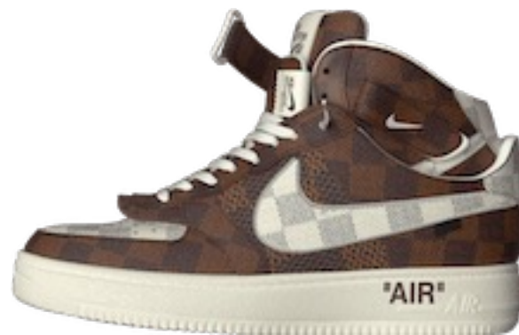
Nike X Louis Vuitton

Все пары этих коллабораций имеют заоблачный ценник.