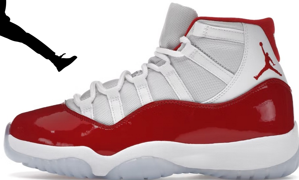
Air Jordan XI. Расцветка Cherry