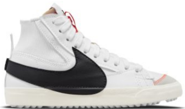
Nike blazer mid 77 Jumbo