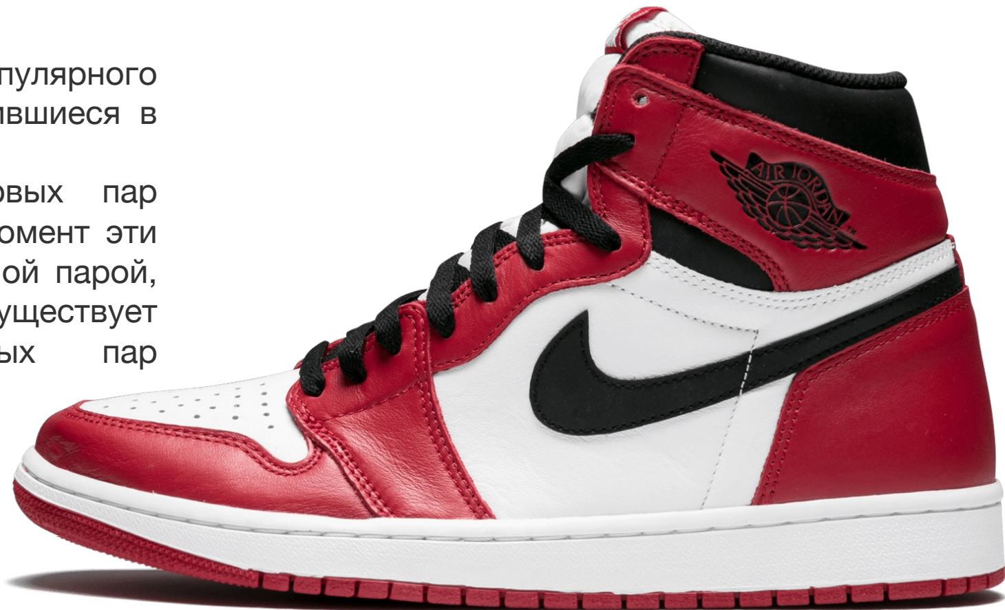
Nike Air Jordan Retro High. Расцветка OG Chicago

Эта пара считается одной из первых пар баскетбольных пар обуви. На данный момент эти кроссовки являются больше повседневной парой, чем баскетбольной, так как сейчас существует множество отличных баскетбольных пар кроссовок.