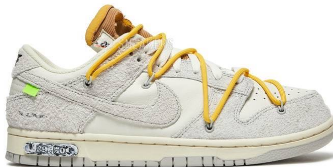
Nike dunk low X Off-White