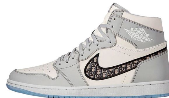
Nike X Dior