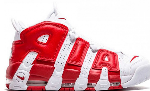
Nike Air more Uptempo