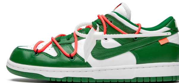
Nike X Off-White